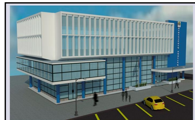
PROPUESTA 1: REHABILITACIÓN AL EDIFICIO DE LA UNIDAD METROPOLITANA