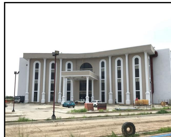
Órgano Judicial de Coclé