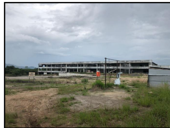
Caja de Seguro Social Coclé