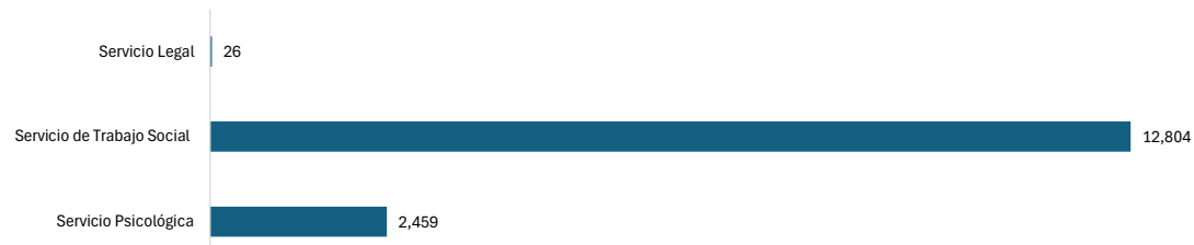
Gráfico 5. NÚMERO DE ATENCIONES EN FASE DE AUDIENCIAS DE JUICIO ORAL, EN DE LA UNIDAD DE PROTECCIÓN A VÍCTIMAS, TESTIGOS, PERITOS Y DEMÁS INTERVINIENTES EN LOS PROCESOS PENALES, POR TIPO DE SERVICIO BRINDADA: DEL 1 DE ENERO AL 30 DE SEPTIEMBRE DEL 2024 (P)