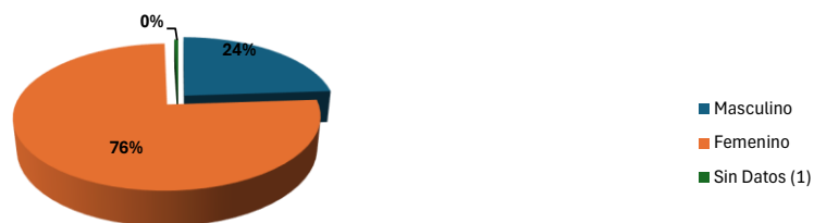
Gráfico 1. DISTRIBUCIÓN PORCENTUAL DE NÚMEROS DE PERSONAS ATENDIDAS EN LA UNIDAD DE PROTECCIÓN A VÍCTIMAS, TESTIGOS, PERITOS Y DEMÁS INTERVINIENTES DE LOS PROCESO PENALES, A NIVEL NACIONAL, POR SEXO: DEL 1 DE ENERO AL 30 DE SEPTIEMBRE DEL 2024 (P)