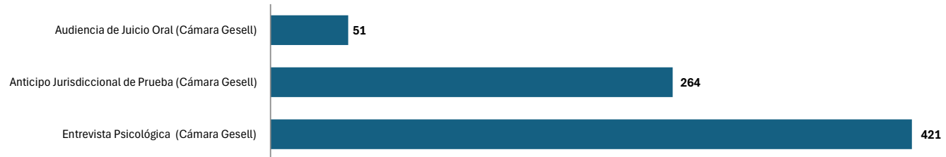
Gráfico 4. NÚMERO DE ATENCIONES DE CÁMARA DE GESELL REALIZADAS DE LOS PROCESOS PENALES A NIVEL NACIONAL, POR TIPO DE SERVICIO: DEL 1 DE ENERO AL 30 DE SEPTIEMBRE DEL 2024 (P)