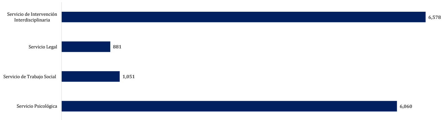
Gráfico 2. CANTIDAD DE ATENCIONES REALIZADAS DE LA UNIDAD DE PROTECCIÓN A VÍCTIMAS, TESTIGOS, PERITOS Y DEMÁS INTERVINIENTES EN LOS PROCESOS PENALES, POR ÁREA GEOGRÁFICA, TIPOS DE SERVICIOS BRINDADOS: DEL 1 DE ENERO AL 31 DE MARZO DEL 2026 (P)

Fuente: Unidad de Protección a Víctimas, Testigos, Peritos y Demás Intervinientes a Nivel Nacional.