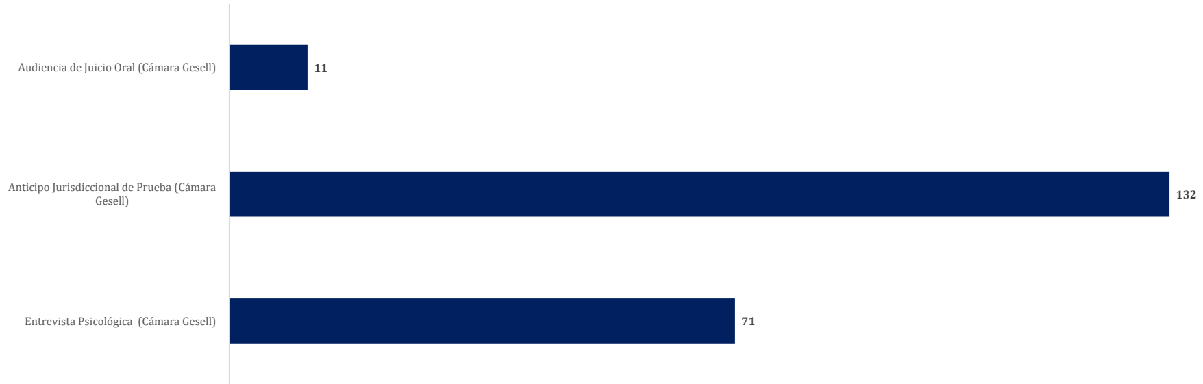
Gráfico 4. NÚMERO DE ATENCIONES DE CÁMARA DE GESELL REALIZADAS DE LOS PROCESOS PENALES A NIVEL NACIONAL, POR TIPO DE SERVICIOS: DEL 1 DE ENERO AL 31 DE MARZO DEL 2026 (P)