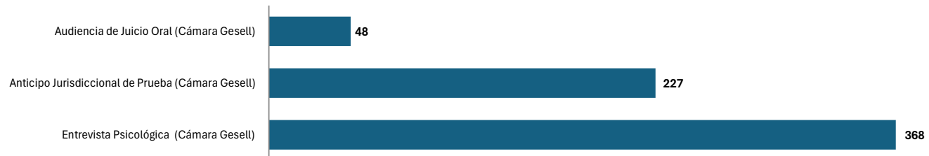
Gráfico 4. NÚMERO DE ATENCIONES DE CÁMARA DE GESELL REALIZADAS DE LOS PROCESOS PENALES A NIVEL NACIONAL, POR TIPO DE SERVICIO: DEL 1 DE ENERO AL 31 DE AGOSTO DEL 2024 (P)