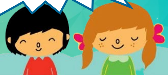
Sala de entrevista

La Cámara Gesell tiene como fin evitar la revictimización. Es considerada una medida de protección, resguardando la integridad y privacidad de la víctima y/o testigo.