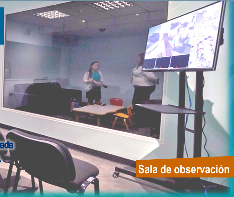
Sala de observación

Cuenta con un vidrio de visión unilateral y está conformada por dos salas: sala de observación y sala de entrevista.