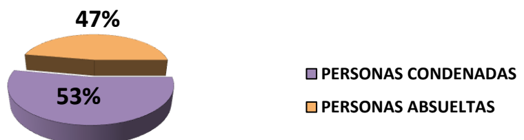
Gráfica 5. SENTENCIA POR PERSONAS EN LA FISCALÍA SUPERIOR ESPECIALIZADA ANTICORRUPCIÓN SEGÚN FALLO: DEL 1 AL 31 DE ENERO DE 2022 (p)