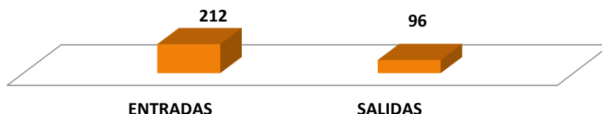
Gráfica 1. MOVIMIENTOS DE EXPEDIENTES Y CARPETAS EN LA FISCALÍA SUPERIOR ESPECIALIZADA ANTICORRUPCIÓN: DEL 1 AL 31 DE ENERO DE 2022 (p)