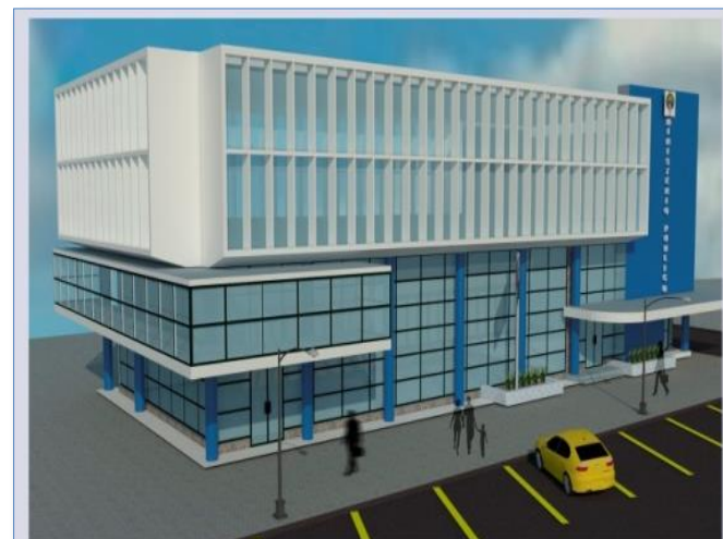
PROPUESTA 1: REHABILITACIÓN AL EDIFICIO DE LA UNIDAD METROPOLITANA

Observación : El 7 de septiembre del 2020 la Empresa Constructora retomó las operaciones administrativas, según el Decreto Ejecutivo N° 1036 de 4 de septiembre de 2020, para el Sector Construcción.