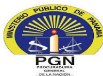
MINISTERIO PÚBLICO PROCURADURÍA GENERAL DE LA NACIÓN Gráfico 1. NÚMERO DE LLAMAMIENTOS A JUICIO REGISTRADOS EN LA REPÚBLICA DE PANAMÁ, POR DISTRITO JUDICIAL 01 AL 31 DE JULIO DE 2020