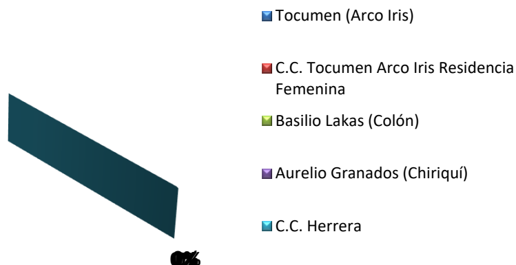
GRÁFICA 2. PORCENTAJE DE PERSONAS PRIVADAS DE LIBERTAD A ÓRDENES DEL MINISTERIO PÚBLICO, SEGÚN CENTRO DE CUMPLIMIENTO DE MENORES: AL 30 DE ABRIL DEL 2019

Nota: En el mes abril no hubo detenidos por la Fiscalías de Adolescentes a ordenes del Ministerio Público.