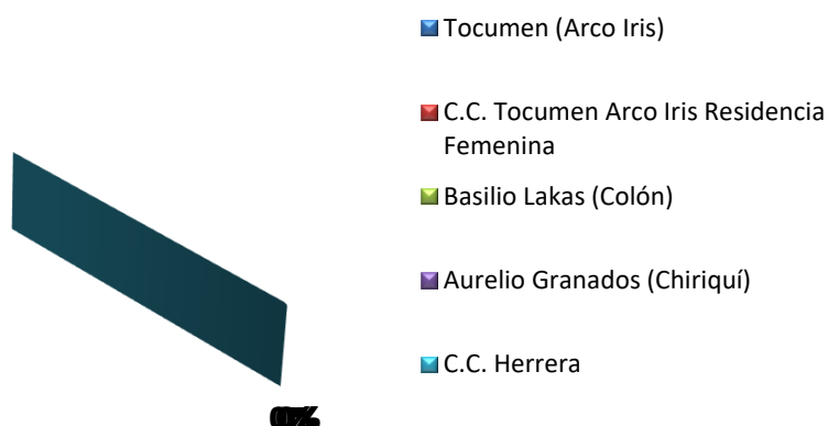
GRÁFICA 4: PORCENTAJE DE PERSONAS PRIVADAS DE LIBERTAD A ÓRDENES DEL MINISTERIO PÚBLICO, SEGÚN CENTRO DE CUMPLIMIENTO DE MENORES: AL 31 DE OCTUBRE 2018

Nota: En el mes de Octubre no hubo menores edad a ordenes del Ministerio Público.