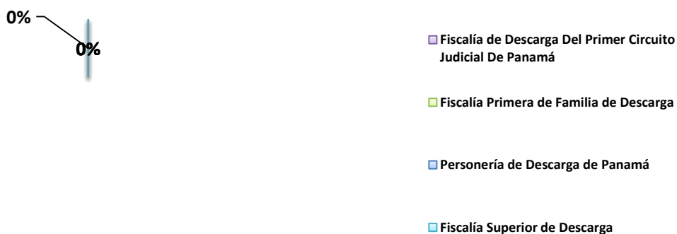
GRÁFICA 2. PORCENTAJE DE PERSONAS PRIVADAS DE LIBERTAD A ÓRDENES DEL MINISTERIO PÚBLICO, SEGÚN DESPACHOS ENCARGADOS DE DESCARGA: AL 31 DE OCTUBRE 2018

Nota: En el mes de Octubre no hubo Privados a Ordenen de las Fiscalías de Descarga