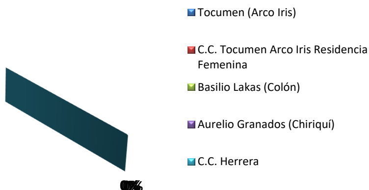
GRÁFICA 3: PORCENTAJE DE PERSONAS PRIVADAS DE LIBERTAD A ÓRDENES DEL MINISTERIO PÚBLICO, SEGÚN CENTRO DE CUMPLIMIENTO DE MENORES: AL 30 DE NOVIEMBRE DE 2018

Nota: En el mes de Noviembre no hubo detenidos por la Fiscalías de Descarga a ordenes del Ministerio Público.