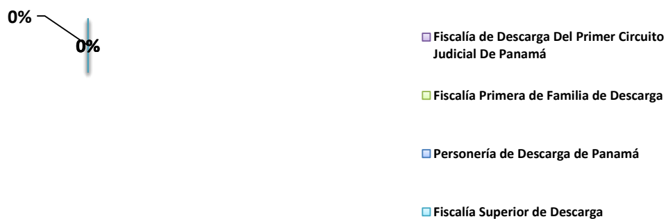
GRÁFICA 2. PORCENTAJE DE PERSONAS PRIVADAS DE LIBERTAD A ÓRDENES DEL MINISTERIO PÚBLICO, SEGÚN DESPACHOS ENCARGADOS DE DESCARGA: AL 30 DE NOVIEMBRE 2018

Nota: En el mes de Noviembre no hubo menores edad a ordenes del Ministerio Público.