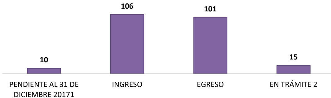
Gráfica 1. MOVIMIENTOS DE EXPEDIENTES: DEL 1 DE ENERO AL 30 DE NOVIEMBRE DEL 2018