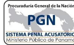
GRAFICO N° 1; MINISTERIO PÚBLICO LLAMAMIENTOS A JUICIO REGISTRADAS EN LA REPÚBLICA DE PANAMÁ POR, TIPO Y DISTRITO JUDICIAL DEL 1 AL 28 DE FEBRERO 2017