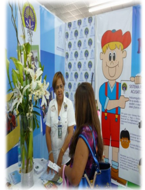
Feria Internacional de David

Este año la organización de este evento estuvo a cargo de la Oficina de Prensa de Panamá con el apoyo de Prensa de Chiriquí, para lo cual todo el equipo de trabajo se dio cita y cumplir con el compromiso.