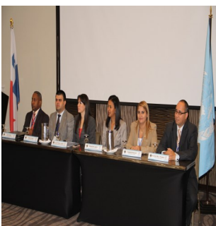
Capacitación sobre SPA a periodistas del Primer Distrito Judicial

reunión también sirvió para designar (a espera del visto bueno por la señora procuradora) los seis funcionarios del MP que en conjunto con dos funcionarios de la DIJ y dos del IMELCF conformarán el equipo técnico que elaborarán esta guía.