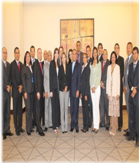
Taller de Elaboración de Guía de Jurisprudencia para el SPA