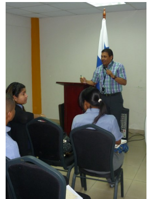
Capacitación en San Miguelito

Por último, los participantes tuvieron la oportunidad de practicar la recepción de una noticia criminal incluso de ver una audiencia realizada en el SPA.